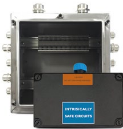
CAJAS DE BORNES Y/O TERMINALES ATEX