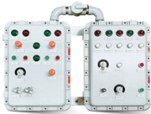
CAJAS ATEX ANTIDEFLAGRANTES EX D