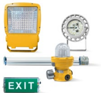
LUMINARIAS LED ATEX