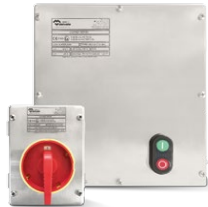
ARRANCADORES DE MOTOR Y INTERRUPTORES