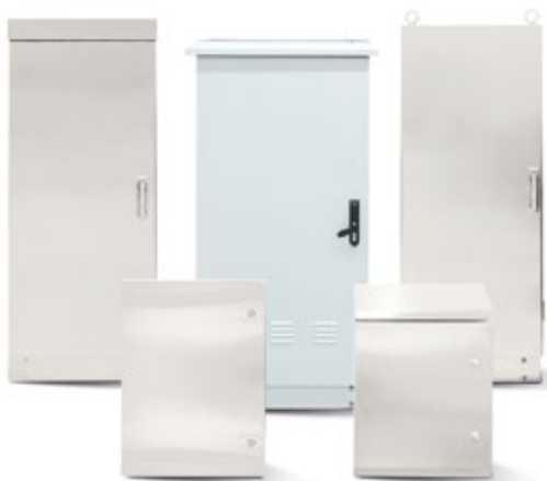
ARMARIOS Y CAJAS PARA ENTORNOS AGRESIVOS