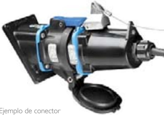
Ejemplo de conector

Los desconectores DXN están diseñados para áreas peligrosas, con el modo de protección 'de'.