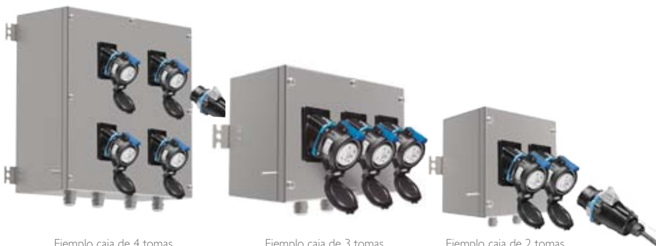
Ejemplo caja de 4 tomas